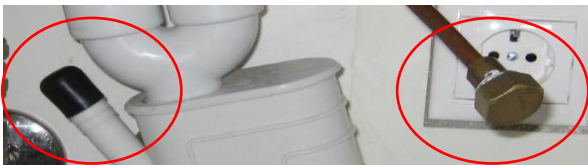
Kuva 1. Astianpesukoneen messinki- ja muovitulppa