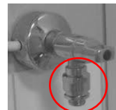
Kuva 2. Pyykinpesukoneen imusuoja